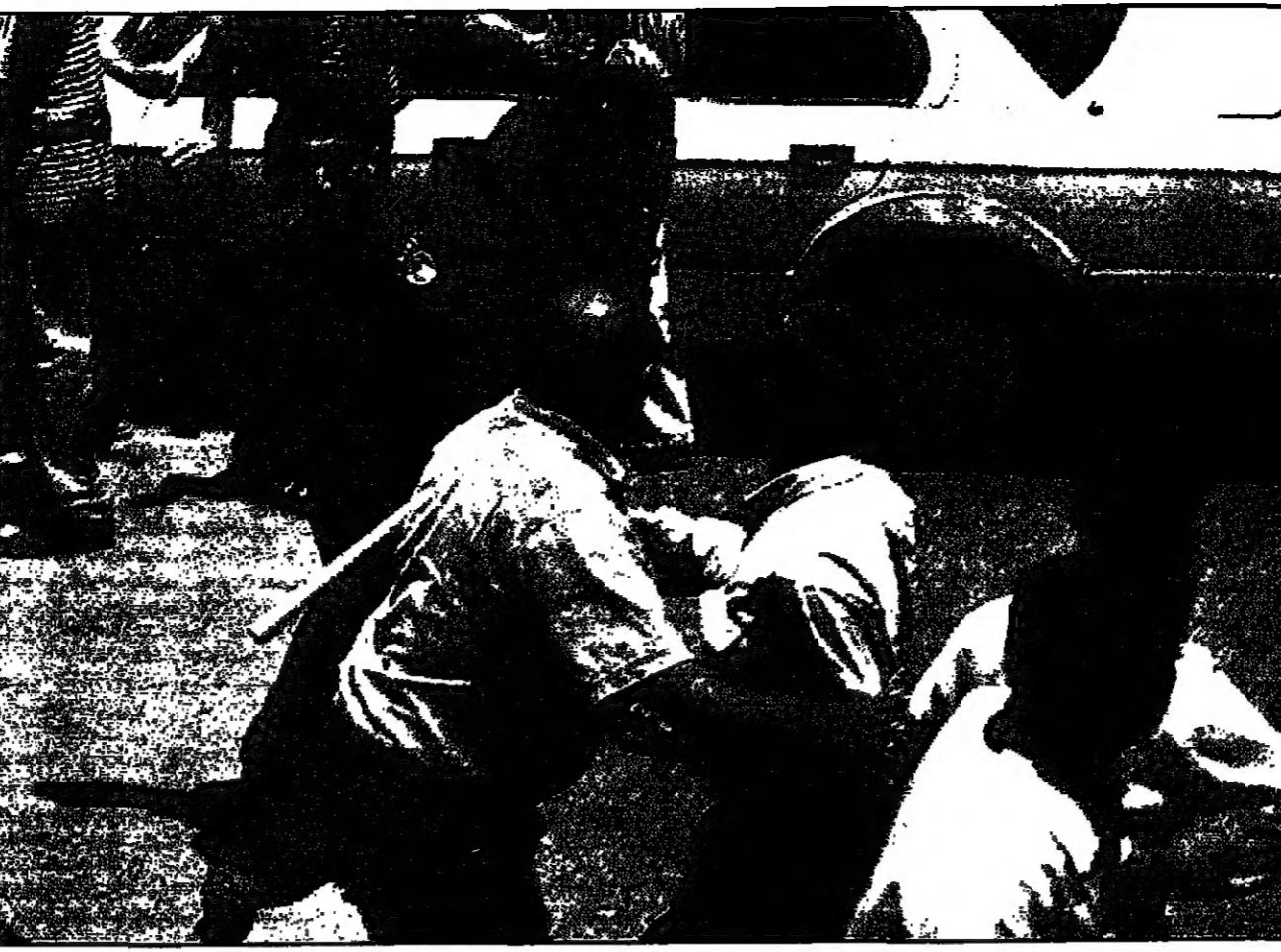
شرفي فلسطيني يتحمل بصمات لنش النزاع بين عائلتين في منية رام الله (روبير)